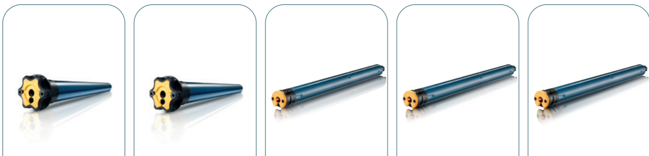
MAESTRIA® 50 SUNEА® 50 SUNEА® 40 ALTUS® 40 LS40/ LT50