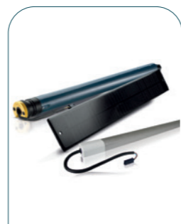
SUNEА® 40 SOLAR IO / RTS