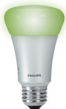
Ampoule couleur E27