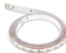
Lighstrip Plus Extension